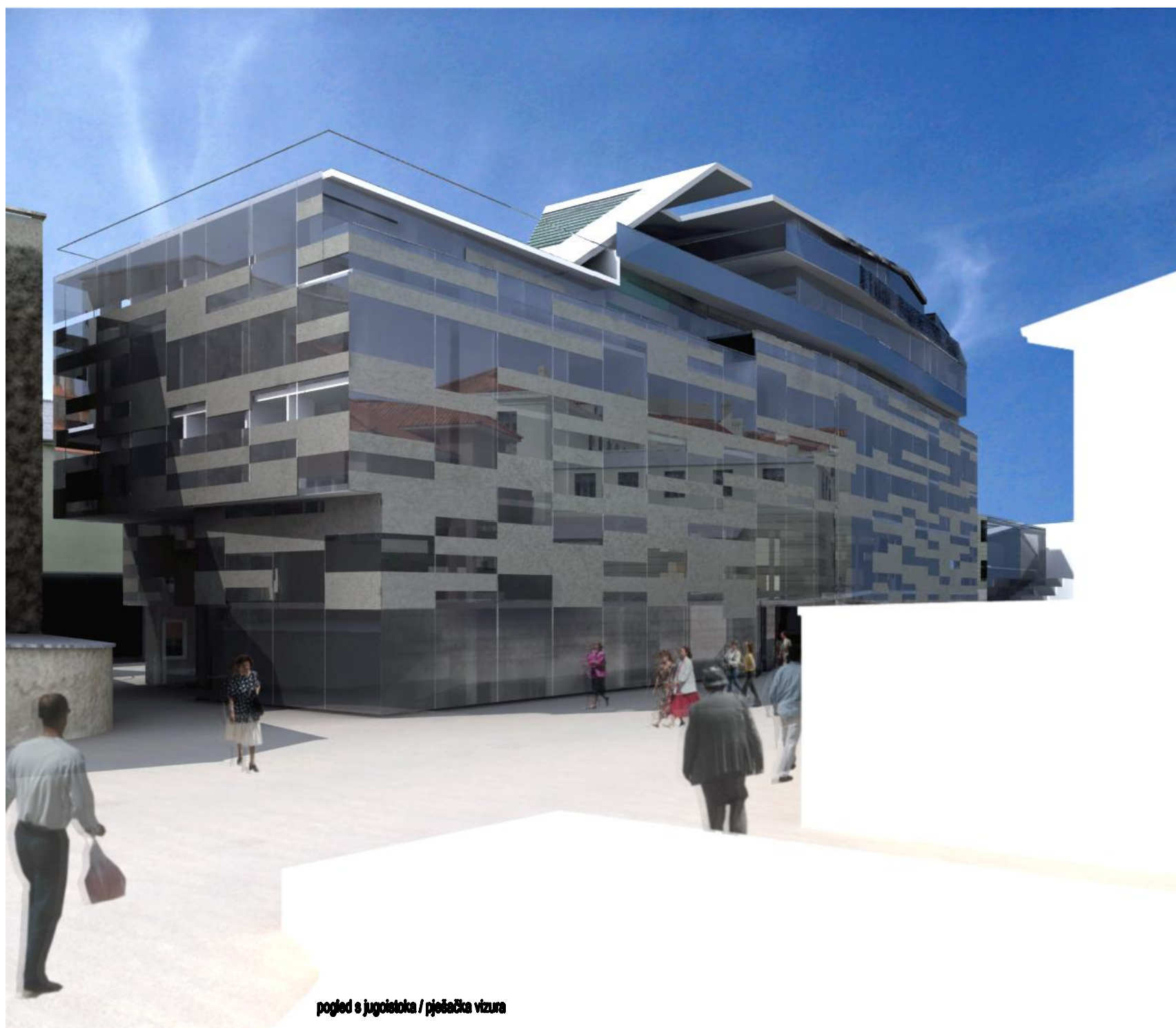
pogled s jugoistoka / pješačka vizura