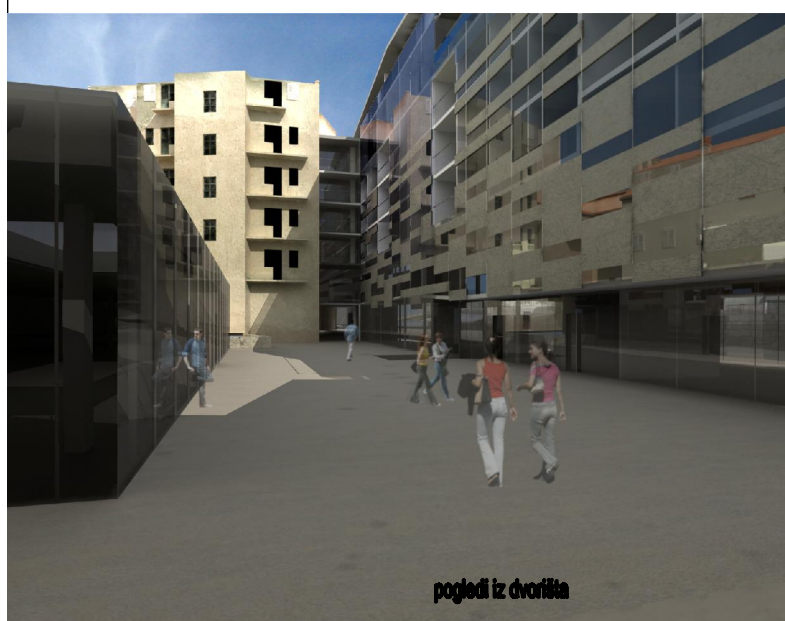
pogledi iz dvorišta