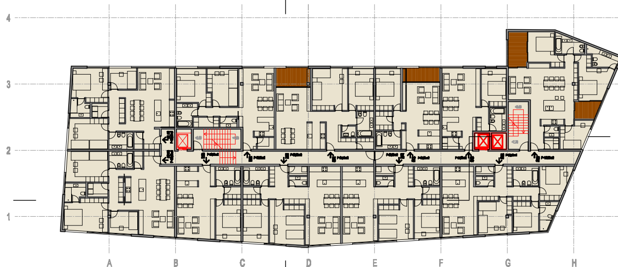
TLOCRT 2. & 3. KATA 1 : 200