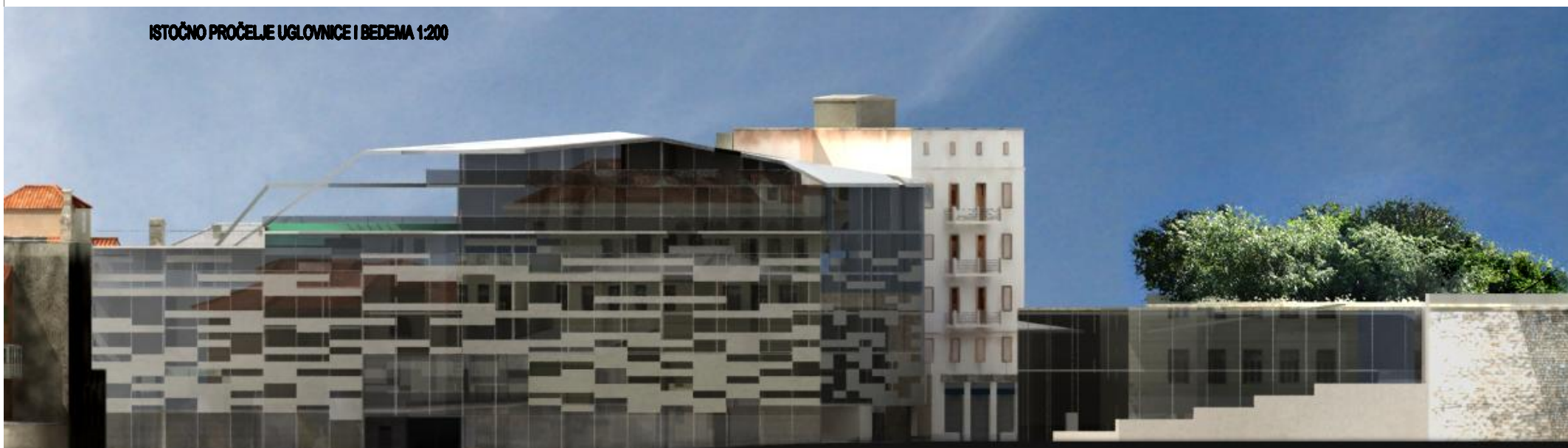
ISTOČNO PROČELJE UGLOVNICE I BEDEMA 1:200