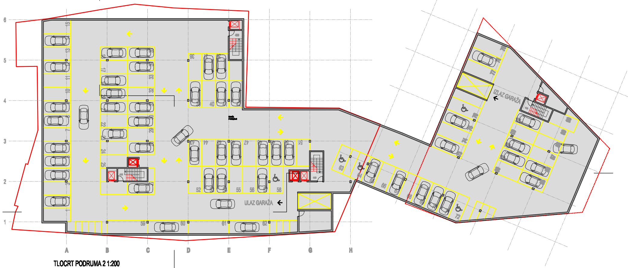
TLOCRT PODRUMA 2 1:200