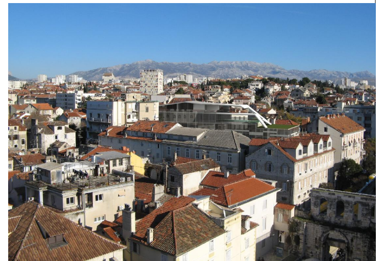
pogled sa Sv. Duje