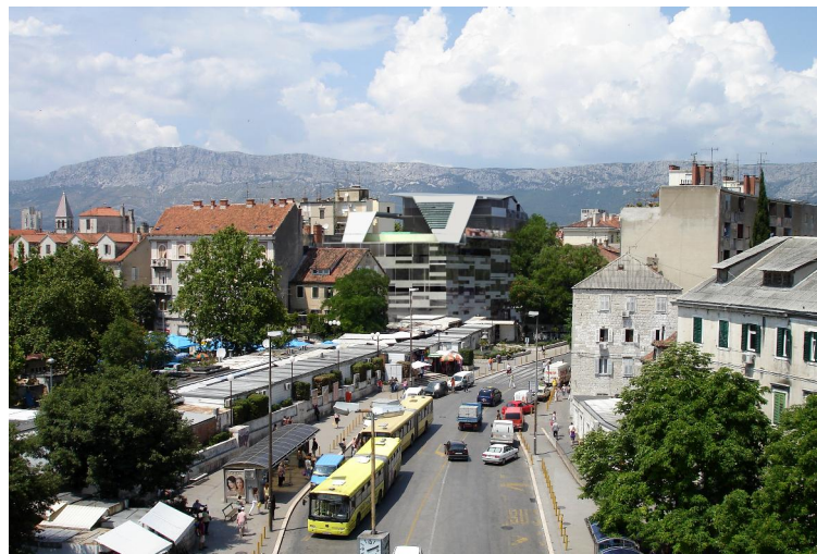
pogled s Biskupove