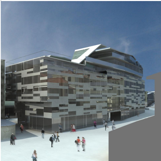
pogled s jugozloka

Budući da se radi o enklavnom prijedlogu bez konkretnih programskih enjnice intervencija predviđaju, kontekstualnu pratnju primarnoj temi nastajanja, ali uz istovremeno doživljajno obogaćenje boravka učnika na otvorenom.