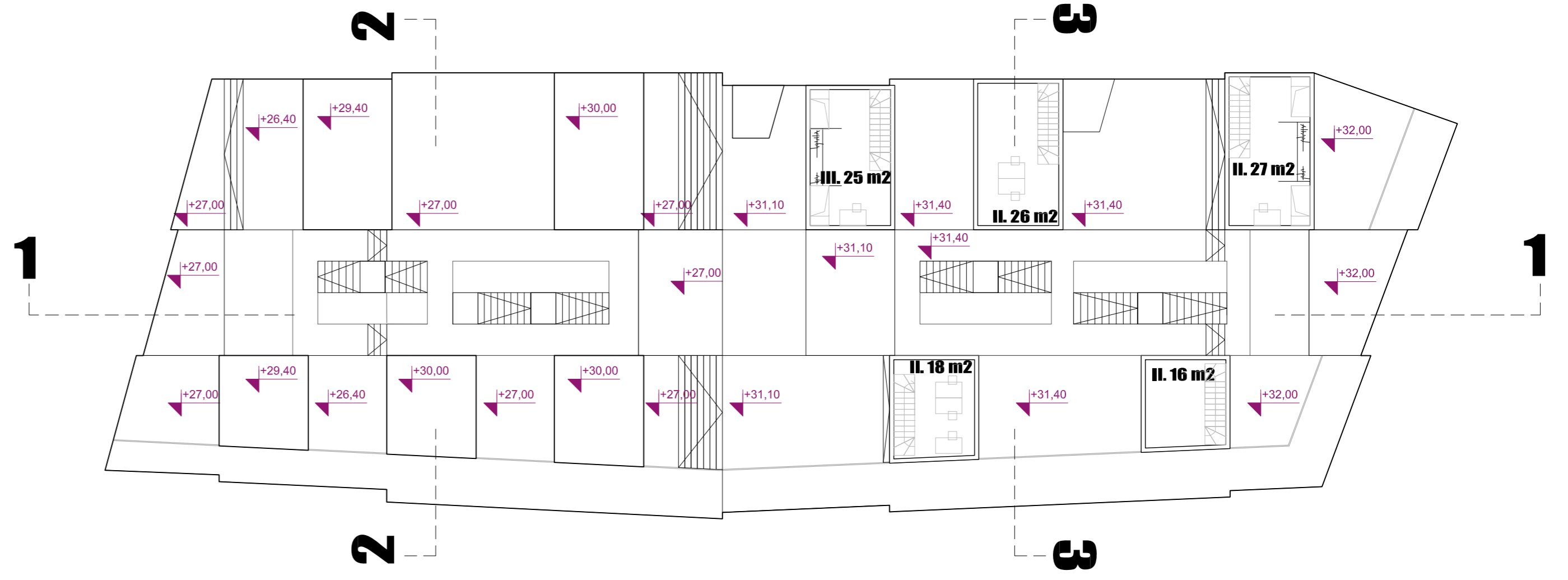
TLOCRT KATA 4